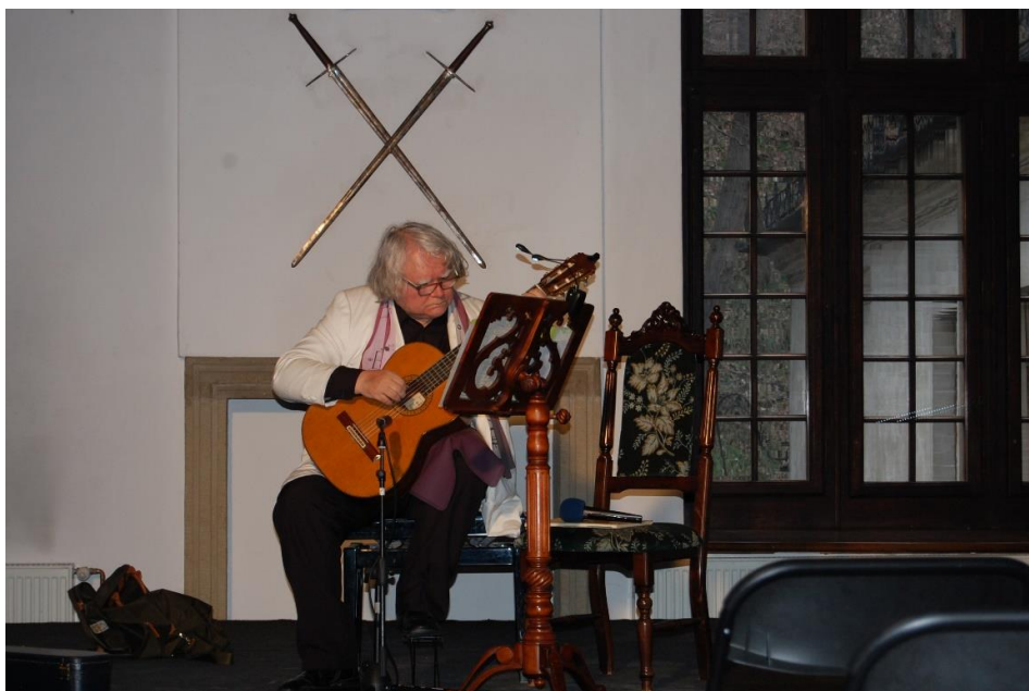
Fot. 1–3. Sala Rycerska zamku w Suchej Beskidzkiej, w której odbywały się obrady konferencji „Bezpieczeństwo informacyjne”